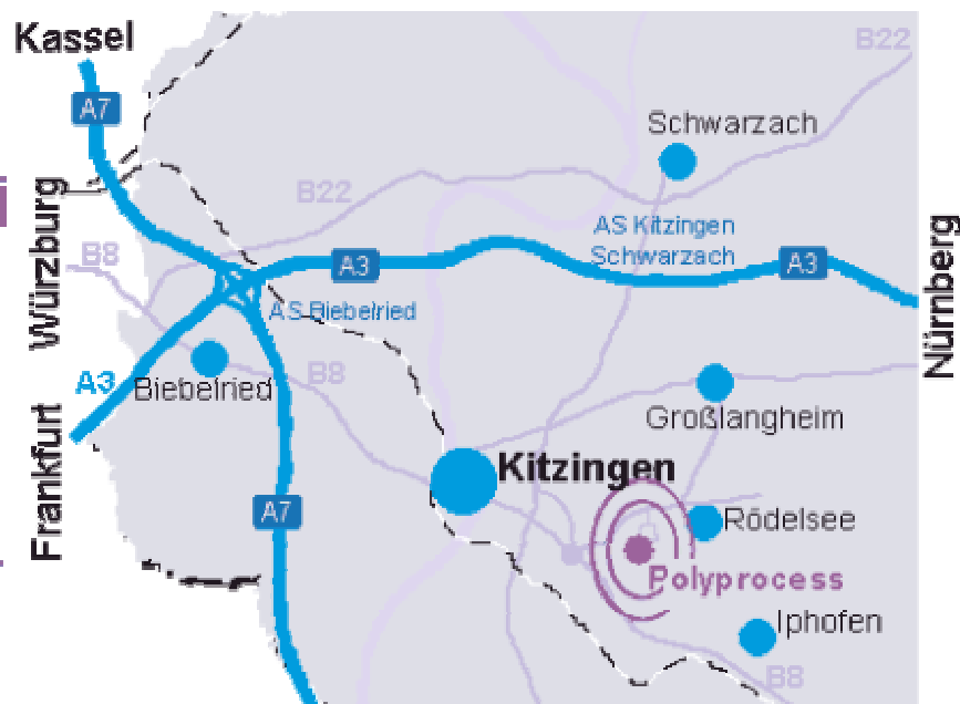
Der Landkreis Kitzingen

Wir wünschen Ihnen eine angenehme Fahrt!